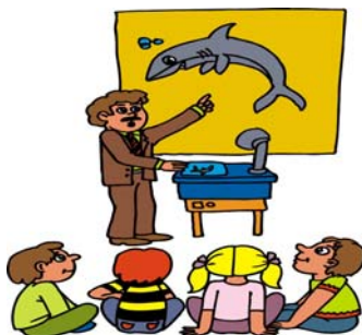
Slika 4; Primena obrazovne tehnologije

Teorijsku osnovu, obrazloženje i opravdanje primene obrazovne tehnologije (sl.4.) u obrazovnom procesu čine znanja iz raznih naučnih oblasti i disciplina, kao što su: pedagogija (didaktika i metodika), psihologija (psihološke teorije učenja, recepcija, pamćenje, pažnja, imaginacija), kibernetika (teorije upravljanja i regulisanja, algoritma i modela, fidbeka), komunikologija. Ove discipline identifikuju razne faktore koji utiču na proces učenja, nastave i efikasnost raznih medija. Razvoj obrazovne tehnologije nije bio unapred smišljen cilj pedagoških stručnjaka.