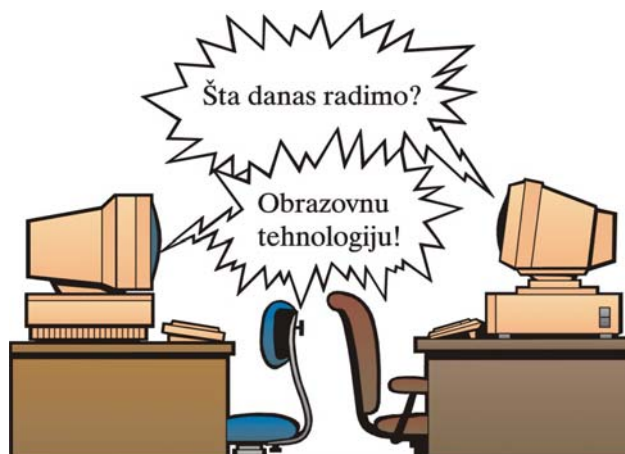
Slika 1: Obrazovna tehnologija

Međutim, očigledno je da postoji i četvrti faktor koji povezuje sva tri navedena elementa, a to je obrazovna tehnologija (sl. 1). Pošto su prva tri elementa, kod nas i u svetskoj literaturi i praksi, relativno dobro proučeni, mi smo redosled proučavanja ovih elemenata promenili, i obrazovnu tehnologiju sa poslednjeg mesta "pedagoškog trougla", tj. "pedagoškog četvorougla" u navedenom redosledu, postavili na prvo mesto, smatrajući je kao "vezivno tkivo" za ostale elemente i jedan od najvažnijih uslova za realizaciju savremenog obrazovnog procesa, procesa učenja. Pored menjanja redosleda osnovnih elemenata obrazovnog procesa , pokušali smo da ga sagledamo sa jednog drugačijeg stanovišta, nego što je to do sada bio slučaj.